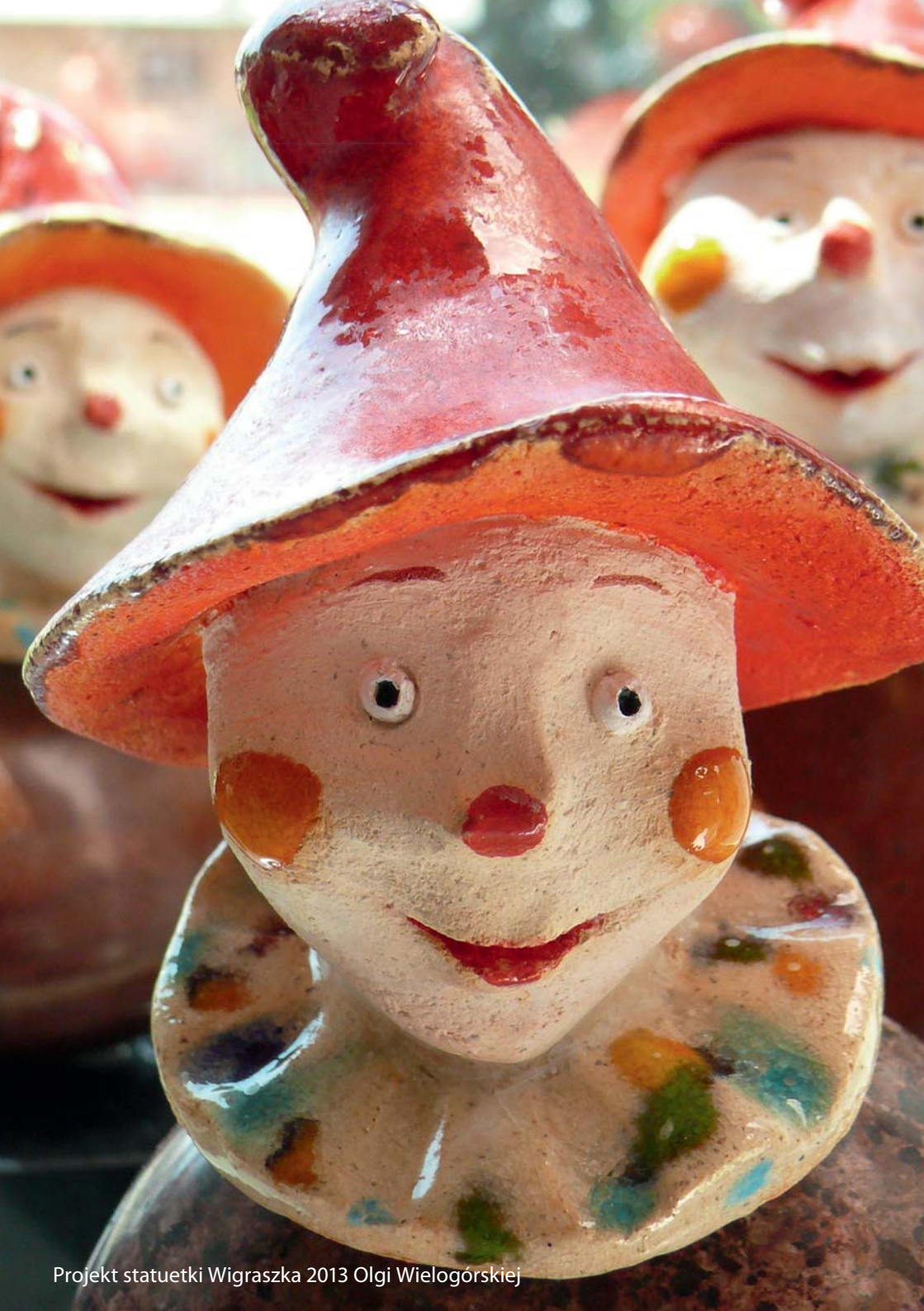
Projekt statuetki Wigraszka 2013 Olgi Wielogórskiej